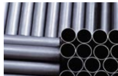
Verpackung, Endkontrolle Versandbereitschaft