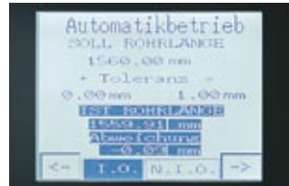
Sägen und Bürstenentgratung Längentoleranz +0,2/-0,2 mm