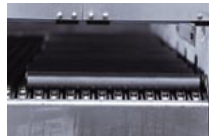
Waschen und temporäres Konservieren