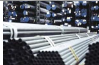
Präzisionsrohrvorratslager aus konzerninterner Produktion